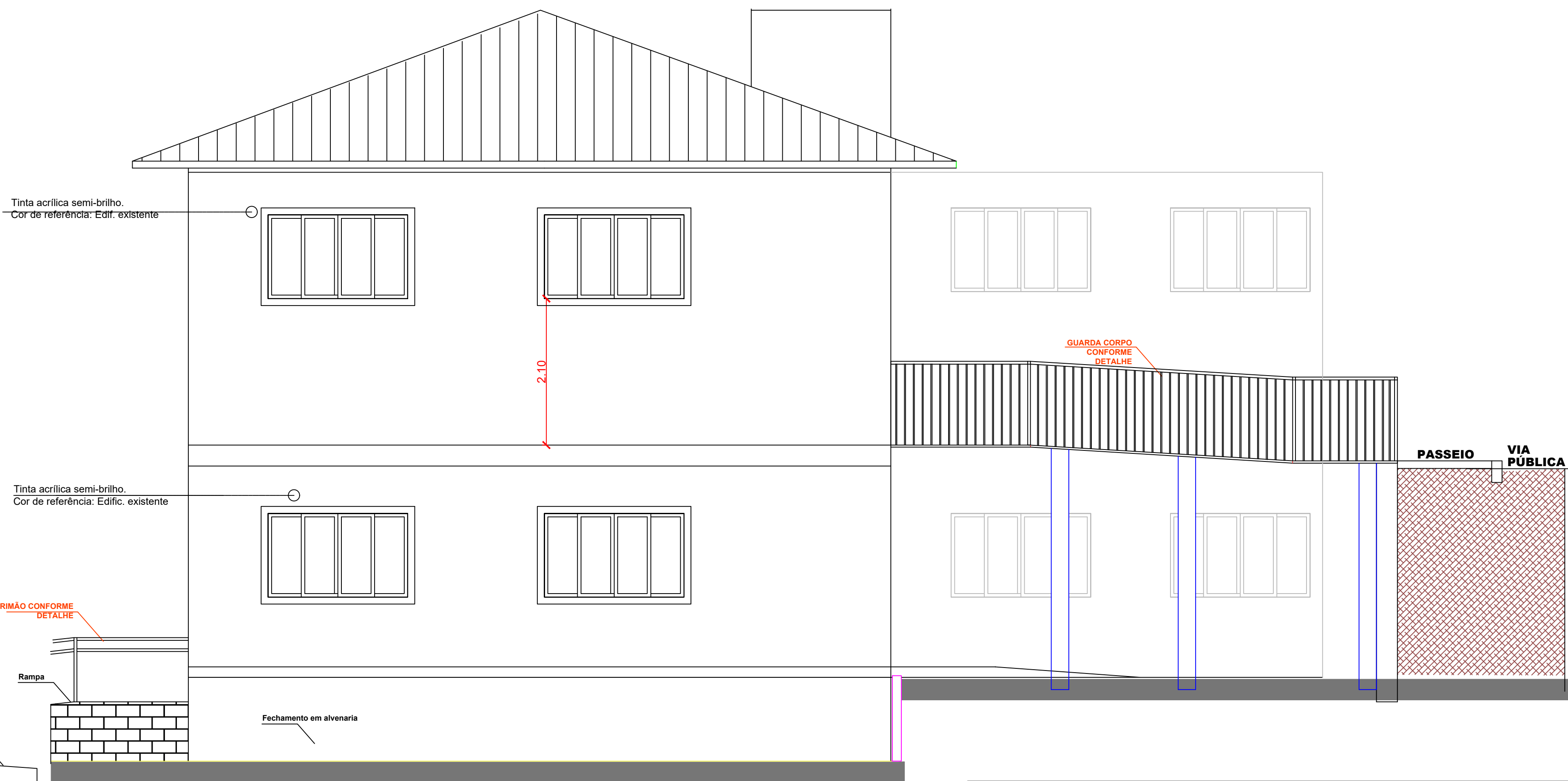
FACHADA LATERAL ESCALA ..... 1:50