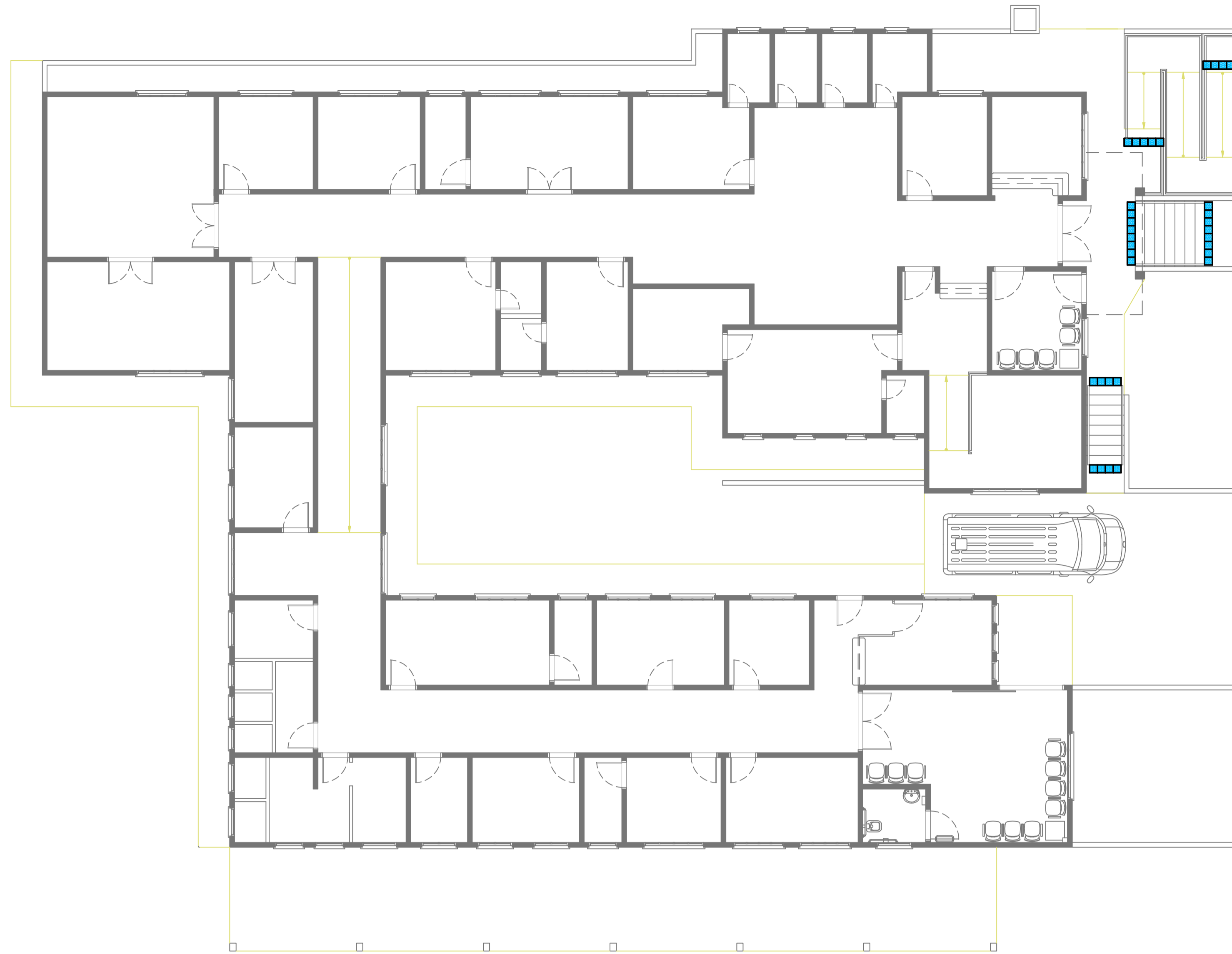
planta baixa - situação existente